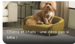
Chiens et chats : une déco pas si bête !