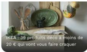
IKEA : 39 produits déco à moins de 20 € qui vont vous faire craquer