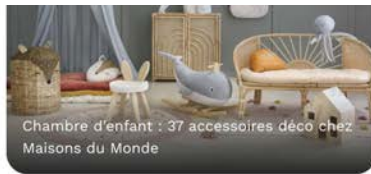
Chambre d'enfant : 37 accessoires déco chez Maisons du Monde